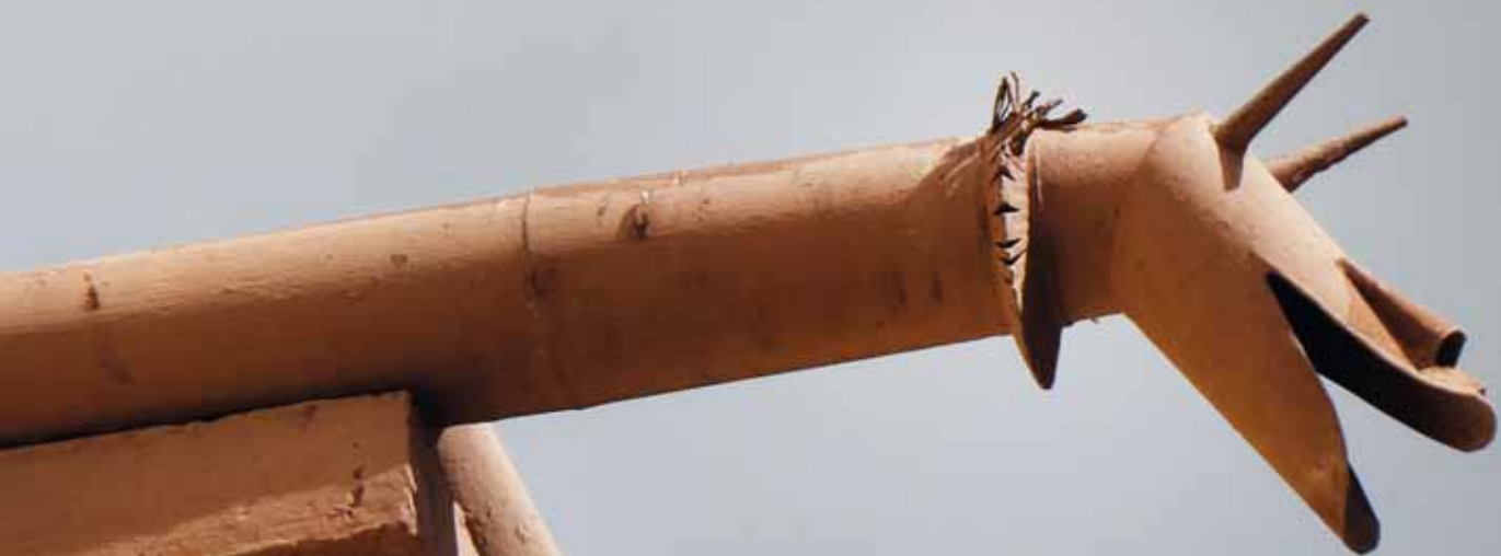
Le père, la mère et le petit gargouillon